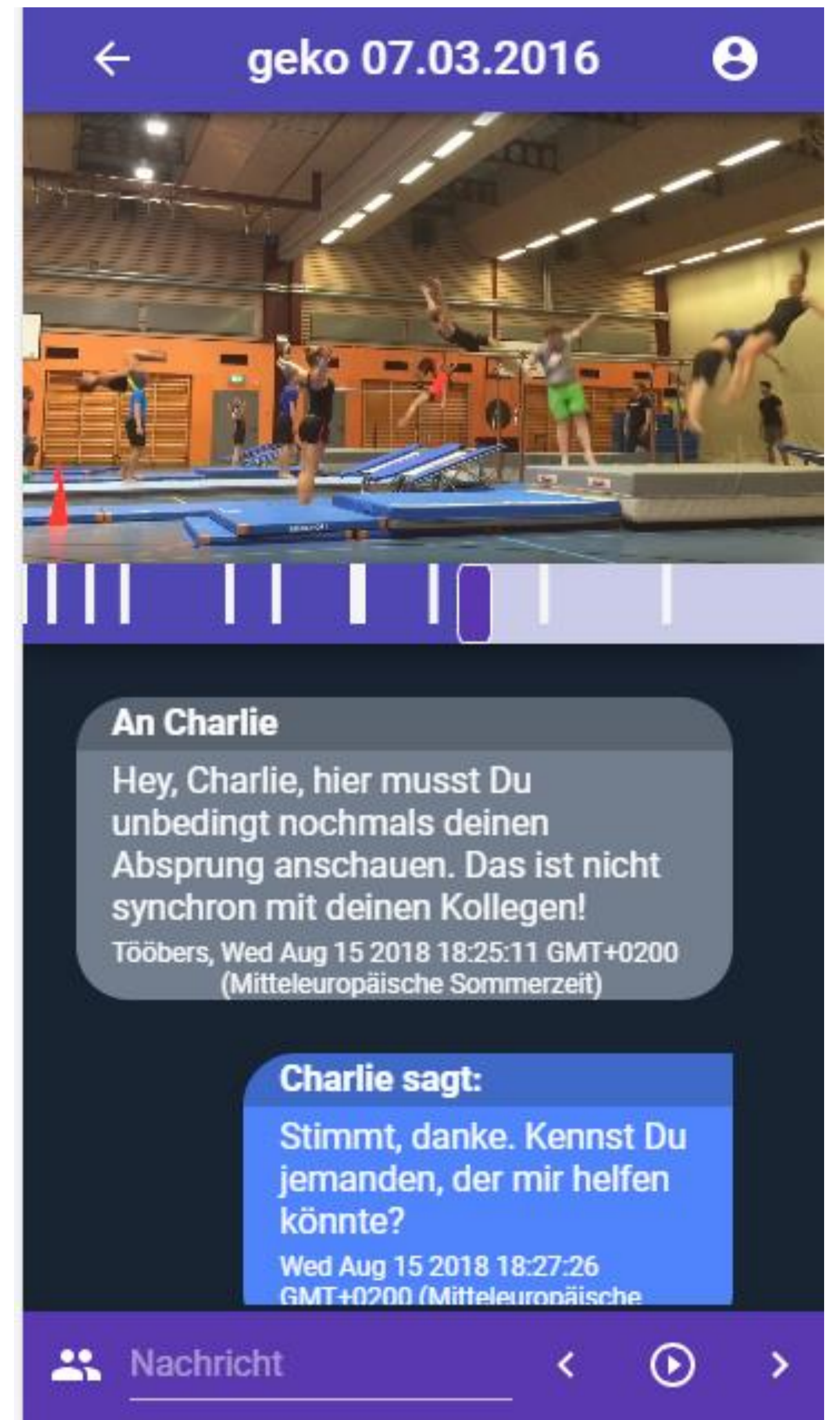
Abb. 1: Mobile Ansicht einer Analyse für einen Turner

Was bedeutet es genau, eine Videoanalyse für einen Turner zu machen? Welche Features benötigen die Mitglieder, welche Rollen gilt es zu berücksichtigen? Wie finden die Turner ihre Verbesserungsvorschläge, und wie können sie allenfalls Fragen darauf stellen? Diese und weitere Fragen mussten vom bearbeitenden Projektteam, bestehend aus Tobias Sigel und Mario Winiker, in den vergangenen 6 Monaten beantwortet werden.